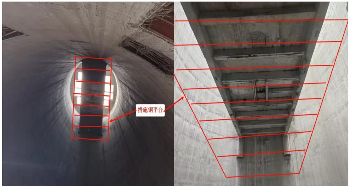
措施钢平台标高位置示意图 (措施钢平台位于混凝土梁下1.7m标高)