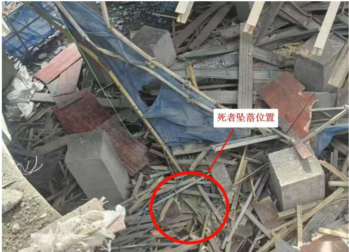
图 3 死者墜落位置图