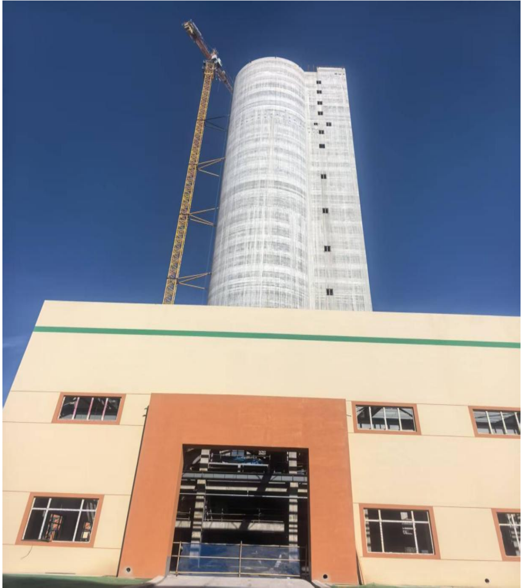
图 1 造粒塔外立面图