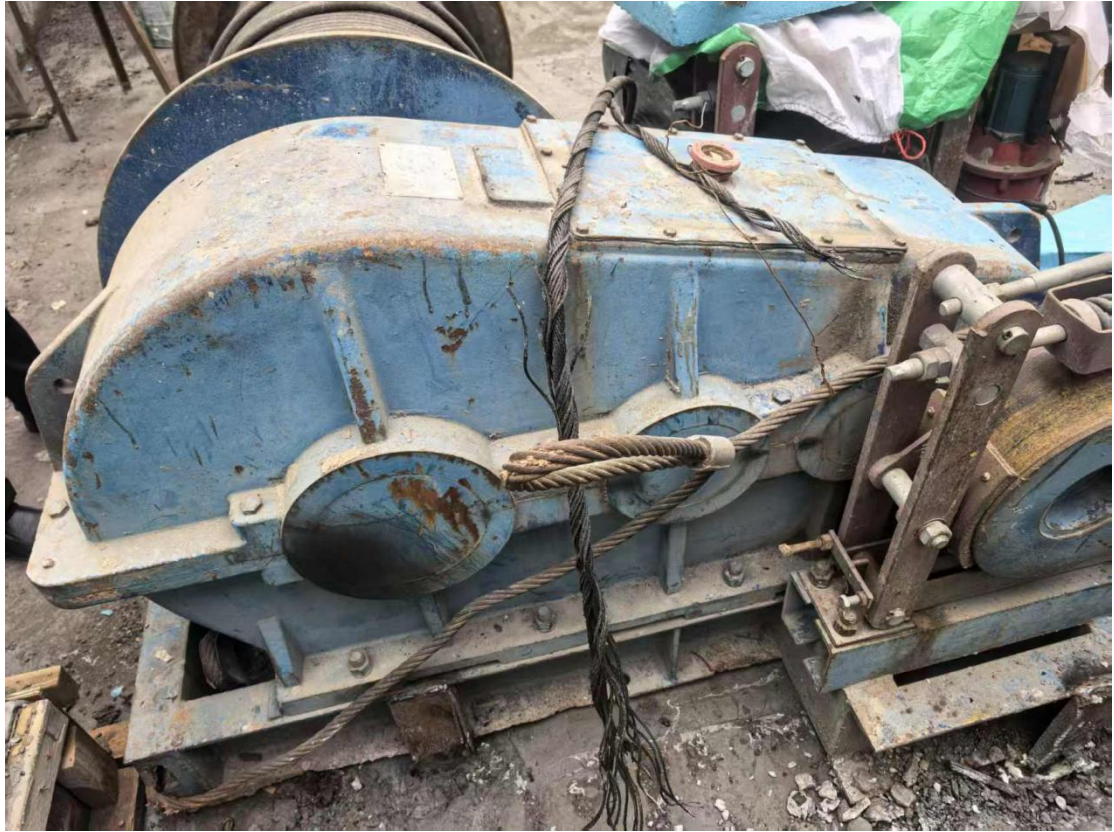
图 6 卷扬机钢丝绳断裂图