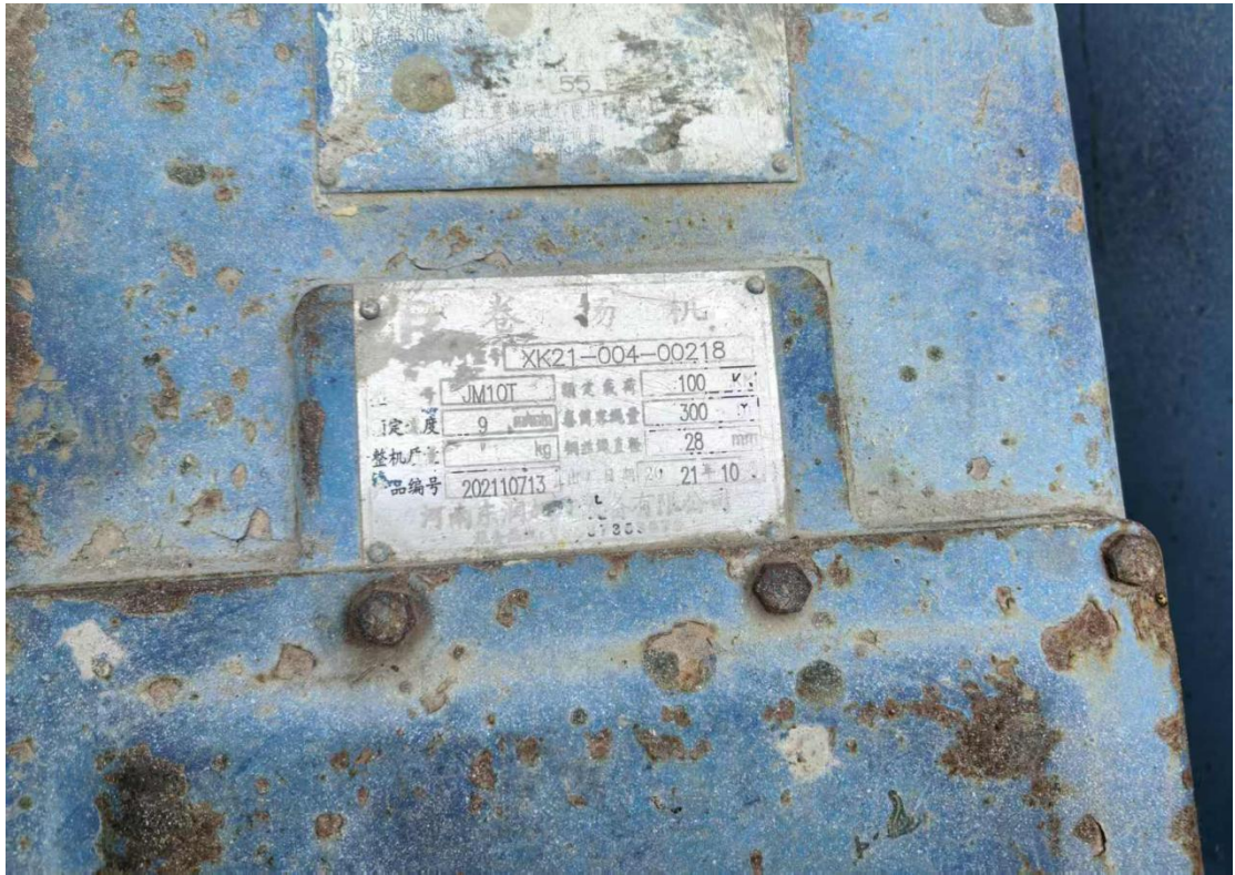
图 7 现场卷扬机铭牌图