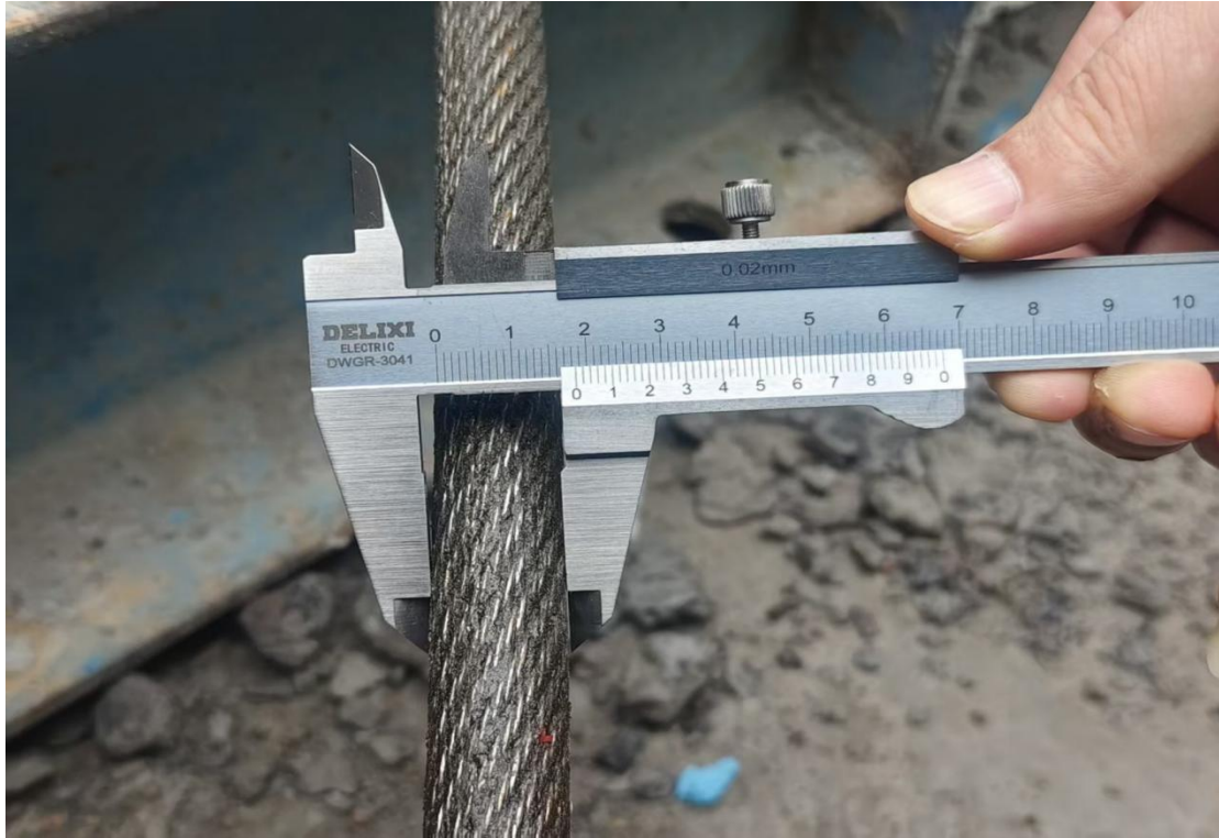
图 8 卷扬机钢丝绳直径不足 \Phi 28 的测量图