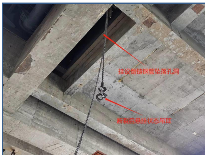
挂设倒链钢管坠落处及吊耳断裂悬挂状态