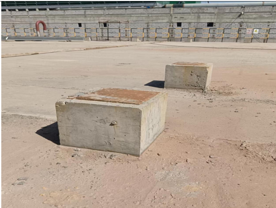
死者摔倒处混凝土支墩照片