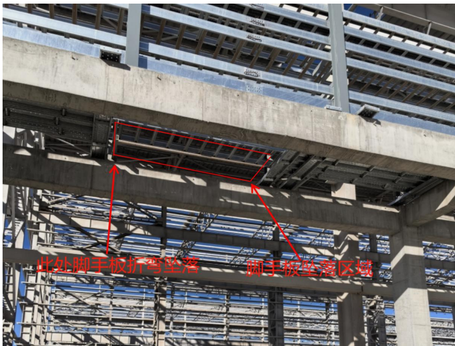
事故坠落点仰视图