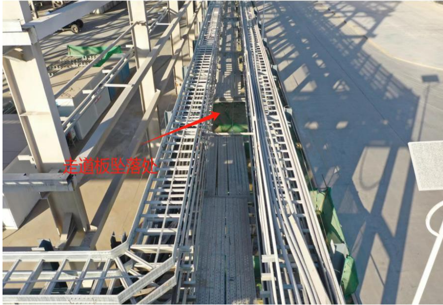
工业管廊架钢质脚手板走道俯视图