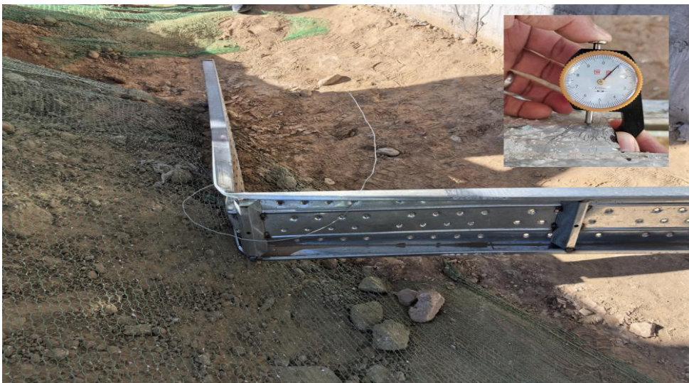
冲压钢板脚手板厚度测量

测量脚手板钢板厚度为 0.95mm，不符合规范要求；未按照规范及方案要求施工，《建筑施工扣件式钢管脚手架安全技术规范》JGJ130-2011 规定第 6.2.4 条：“脚手板的设置应符合下列规定：冲压钢脚手板、木脚手板、竹串片脚手板等，应设置在三根横向水平杆上。当脚手板长度小于 2m 时，可采用二根横杆横向水平支承，但应将脚手板两端与横向水平杆可靠固定，严防倾翻”。事故坠落处实际搭设脚手板 3m 长大于 2m 长，在两端头各采用一块钢质脚手板作为横向支承，中间缺少一处横向支承，不符合规范要求。事发时，作业人员脚下东西方向搭设的横向支承钢质脚手板弯折，造成人员坠落。